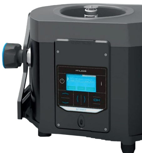
Centrifugação por disco de rotação